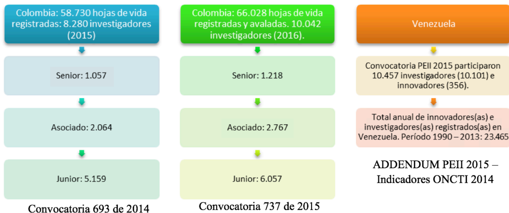
Figura 6. Número de investigadores en Colombia y Venezuela