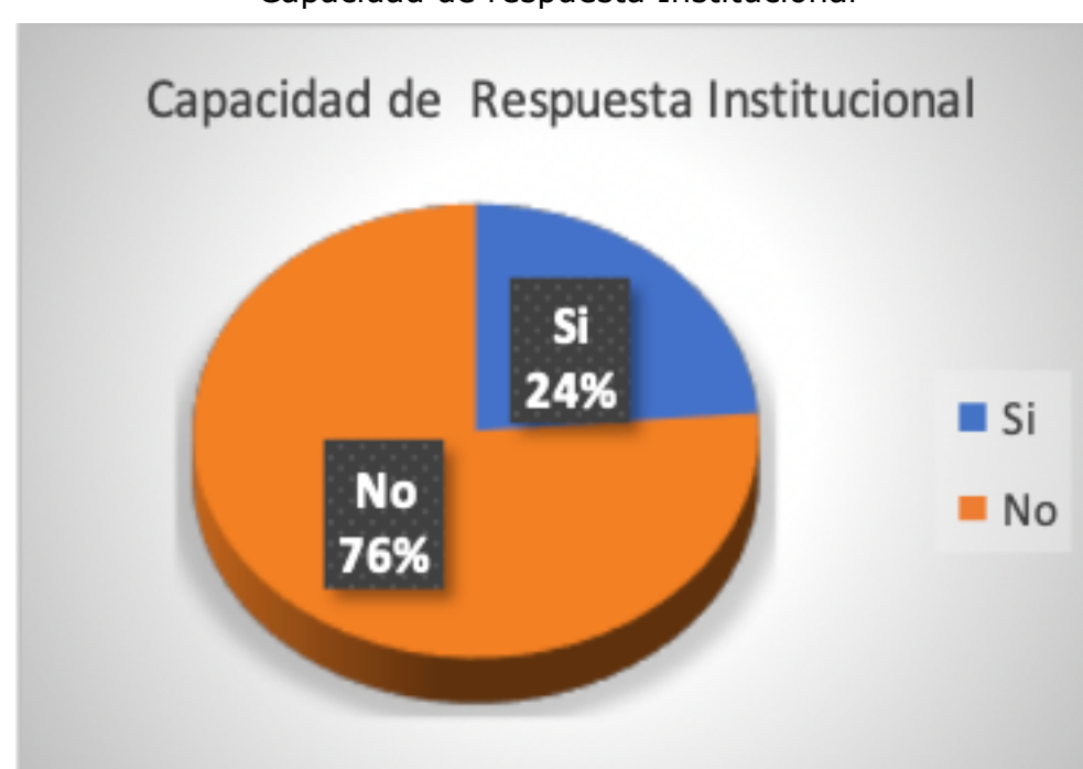
Figura 2 Capacidad de respuesta Institucional